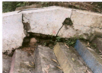
Foto : reparacion de losa