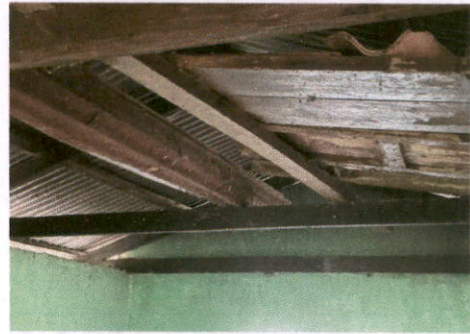
Foto2: Sustitucion de soporte de madera por metal