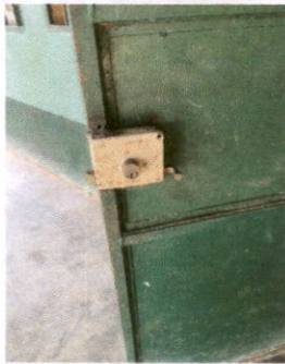
Foto: sustitucion de chapas